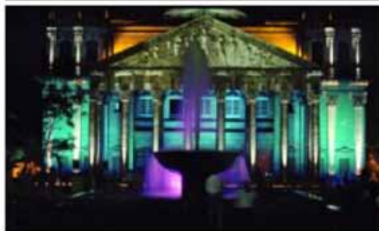
» El Teatro Degollado produce un atractivo juego de luces.