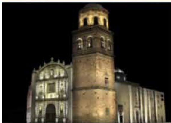
> Con la iluminación los inmuebles recobran vida durante la noche.

Desde sus primeras intervenciones en el Teatro Degollado y en la Plaza de la Liberación, el arquitecto no buscó crear una escenografía en abstracto, sino más bien lograr un conjunto armónico donde la luz matizara y pusiera los acentos necesarios sin afectaciones.